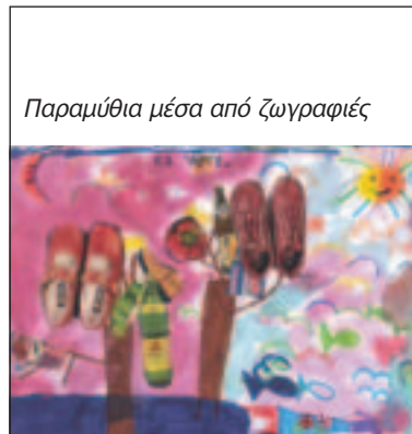
Παραμύθια μέσα από ζωγραφιές