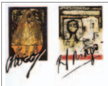
Έκθεση σύγχρονης κουβανέζικης τέχνης