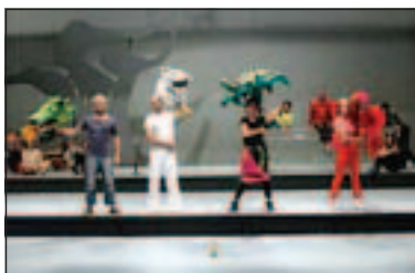
Ο αυτοκράτορας και το Αηδόνι