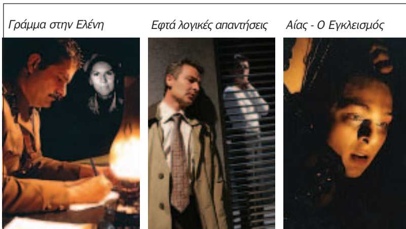
Γράμμα στην Ελένη