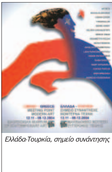
Ελλάδα-Τουρκία, σημείο συνάντησης

ΘΕΑΤΡΙΚΗ ΠΑΡΑΣΤΑΣΗ «Αίας - Ο Εγκλεισμός», σε σκηνοθεσία Στέργιου Καλφόπουλου, 23 Οκτωβρίου – 19 Δεκεμβρίου 2004, θέατρο «Τεχνουργείο» (Αγ. Δημητρίου 121), Θεσσαλονίκη.