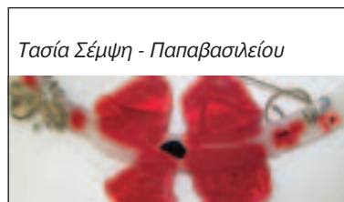
Τασία Σέμψη - Παπαβασιλείου