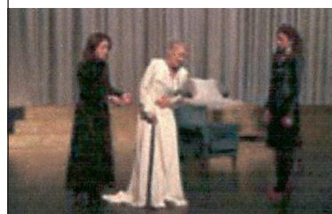
3 υψηλές κυρίες