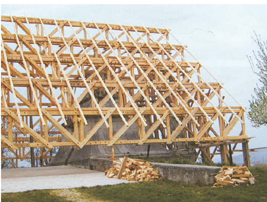
Αποκατάσταση ξύλινων εκκλησιών της Τρανσυλβανίας. Αρχιτέκτονας: Niels Auner