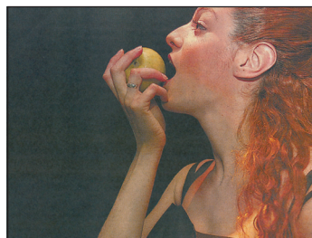
Bash - κοσμικό γεγονός

ΠΑΡΑΣΤΑΣΗ με τους «Άγαμοι Θύται International», από 16 Απριλίου 2004, Principal, Θέρμη Θεσσαλονίκης.