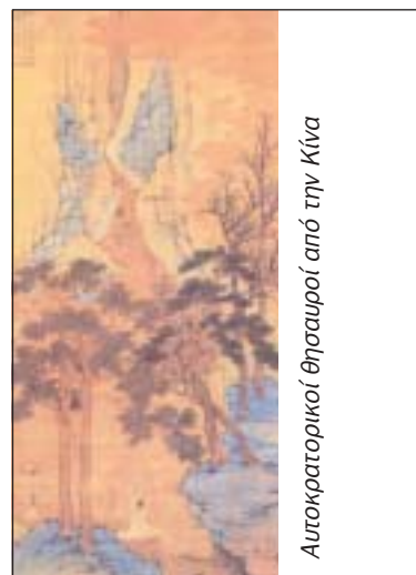
Αυτοκρατορικοί θησαυροί από την Κίνα