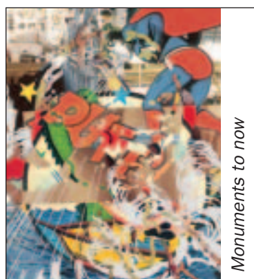
Monuments to now