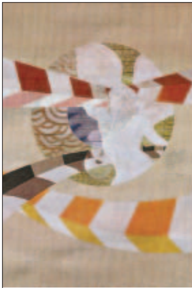
Έκθεση ζωγραφικής και φωτογραφίας της δωρεάς Δημητρίου Μείμαρογλου