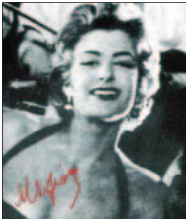
Μέρες έκφρασης και δημιουργίας