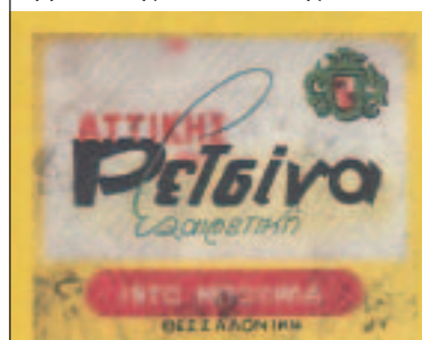
Η εμπορική δραστηριότητα των Εβραίων της Θεσσαλονίκης

ΕΚΘΕΣΗ «Η εμπορική δραστηριότητα των Εβραίων της Θεσσαλονίκης κατά τη διάρκεια του Μεσοπολέμου», Οκτώβριος - Νοέμβριος 2004, «λθ' Δημήτρια», Εβραϊκό Μουσείο, Θεσσαλονίκη.