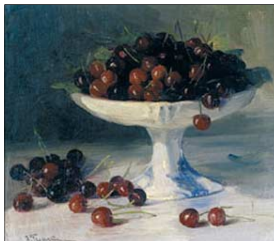
Πολυδιάστατη έκθεση ζωγραφικής, χαρακτηριστικής και χρηστικών αντικειμένων