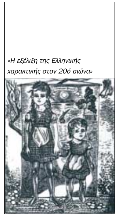
«Η εξέλιξη της Ελληνικής χαρακτηριστικής στον 20ό αιώνα»