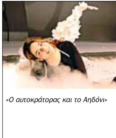
«Ο αυτοκράτορας και το Αηδόνι»

ΘΕΑΤΡΙΚΗ ΠΑΡΑΣΤΑΣΗ «Καρφώνοντας καρφιά στο πάτωμα με το κούτελο» διαδραστικό δρώμενο του Eric Bogosian, από την Εταιρεία Θε-