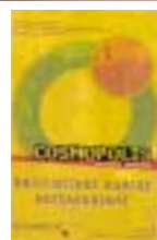
«COSMOPOLIS 1, MICROCOSMOS x MACROCOSMOS»