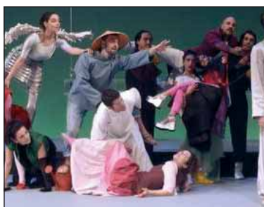
«Ο αυτοκράτορας και το Αηδόνι»

ΘΕΑΤΡΙΚΗ ΠΑΡΑΣΤΑΣΗ «Όνειρο καλοκαιρινής νύχτας» του Σαίξπηρ, από την Πειραματική Σκηνή της «Τέχνης», 10 Οκτωβρίου 2004 - 24 Απριλίου 2005, θέατρο «Αμαλία», Θεσσαλονίκη.