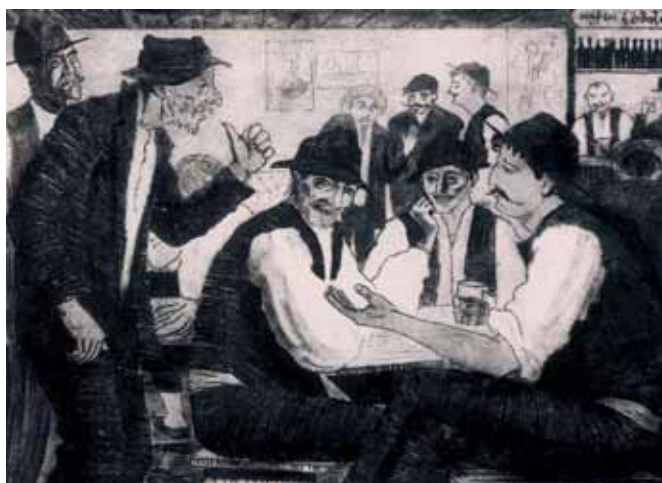
Η εξέλιξη της Ελληνικής χαρακτικής στον 20ό αιώνα