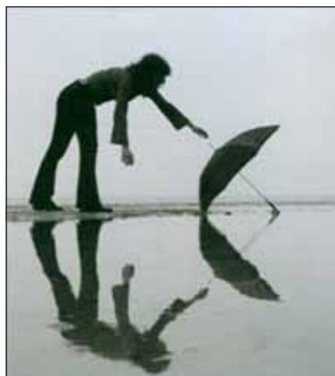
Digital Photography Greece