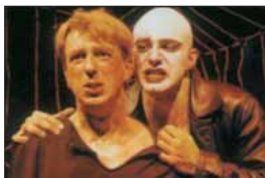
Κάθε μέρα κι ένα έγκλημα