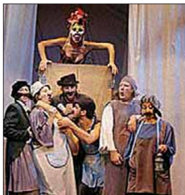
Όνειρο καλοκαιρινής νύχτας

ΘΕΑΤΡΙΚΗ ΠΑΡΑΣΤΑΣΗ «Κάθε μέρα κι ένα έγκλημα» της Αγκάθα Κρίστι, 14 Ιανουαρίου - τέλη Μαρτίου 2005, θέατρο «Παράθλαση» (Κασσάνδρου 132), Θεσσαλονίκη.