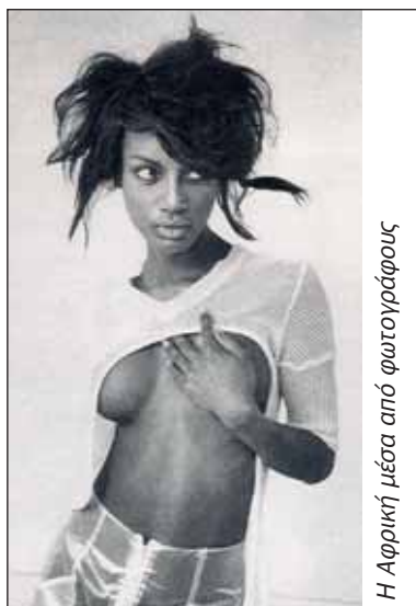
Η Αφρική μέσα από φωτογράφους