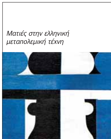
Ματιές στην ελληνική μεταπολεμική τέχνη