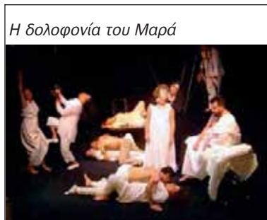
Η δολοφονία του Μαρά