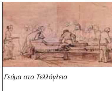
Γεύμα στο Τελλόγλειο