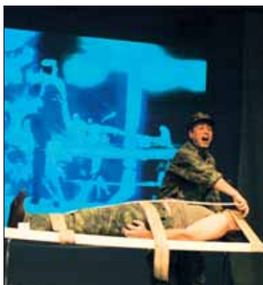
Καρφώνοντας καρφιά στο πάτωμα με το κούτελο