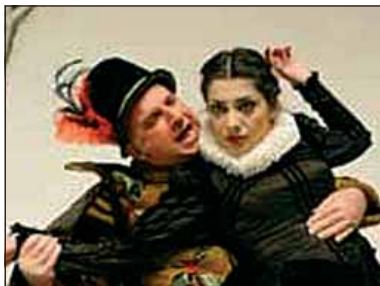
Τέλος καλό, όλα καλά