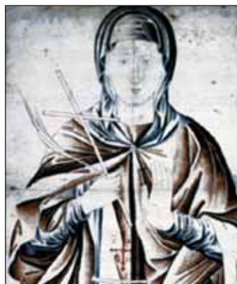
Εκ Χιονάδων ...Σπουδές και ανθίβολα