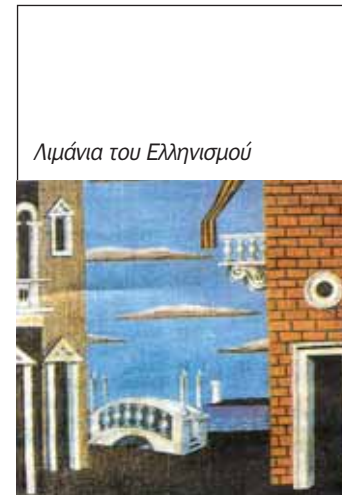
Λιμάνια του Ελληνισμού