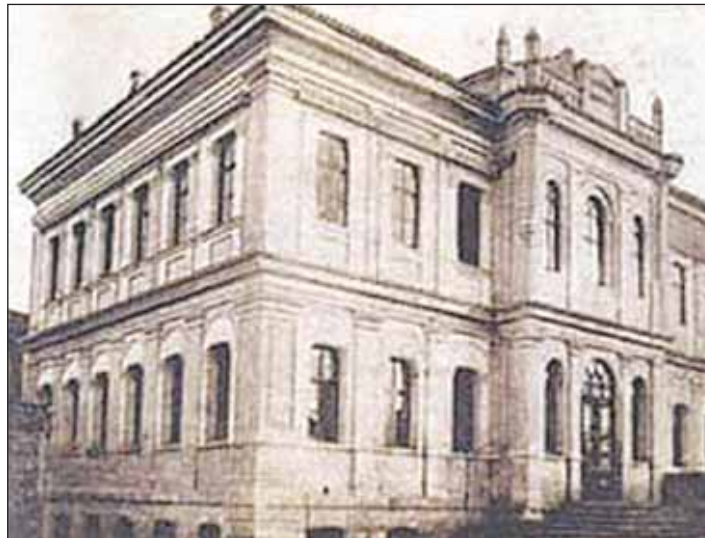
Βιβλιοθήκες του Ελληνισμού

2° ΔΙΕΘΝΕΣ ΣΥΝΕΔΡΙΟ «Αρχαία Ελληνική Τεχνολογία», 17 – 20 Οκτωβρίου 2005, ΤΕΕ – ΕΜΑΕΤ – ΚΔΕΜΤ, Αθήνα.