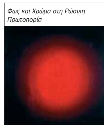
Φως και Χρώμα στη Ρώσικη Πρωτοπορία