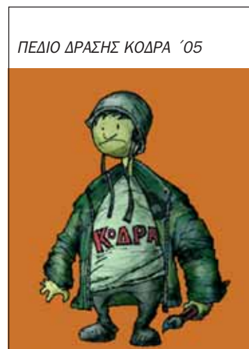
ΠΕΔΙΟ ΔΡΑΣΗΣ ΚΟΔΡΑ '05