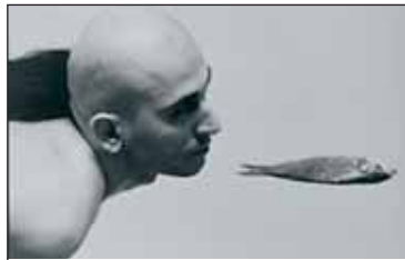
Σύγχρονες όψεις της Βαλκανικής Φωτογραφίας

ΜΕΓΑΛΗ ΑΝΑΔΡΟΜΙΚΗ ΕΚΘΕΣΗ , με τίτλο «Βιντεογραφίες - Οι Πρώτες Δεκαετίες», με διάσημους καλλιτέχνες της video art, 13 Ιουλίου - 4 Σεπτεμβρίου 2005, «Εργοστάσιο» της Σχολής Καλών Τεχνών, Αθήνα.