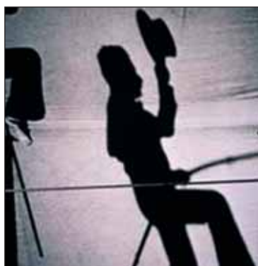
ΠΟΡΤΕΣ ΑΝΟΙΧΤΟΥ ΘΕΑΤΡΟΥ 2005