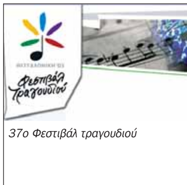
37ο Φεστιβάλ τραγουδιού

ΣΥΝΑΥΛΙΑ , με το μουσικό συγκρότημα τζαζ «Jazz Pistoles», 5 Οκτωβρίου 2005, μ΄ ΔΗΜΗΤΡΙΑ 2005, Ινστιτούτο Γκαίτε, Θεσσαλονίκη.