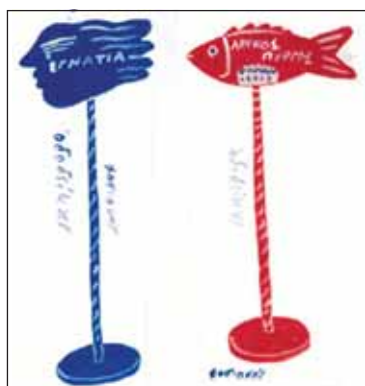
Τάσης Παπαϊωάννου και Αλέκου Φασιανός