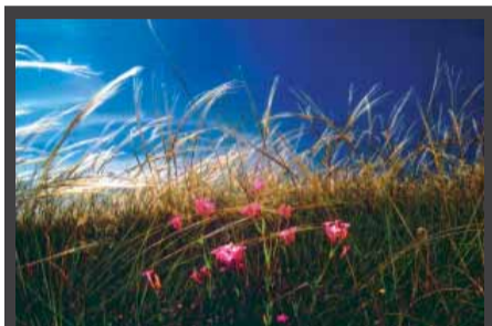
Το πρώτο βραβείο παίρνει ο Miroslav Jeremic από τη Σερβία. θέμα : «Centaurium erythraea»

Από τις 600 φωτογραφίες που λάβαμε έχουν επιλεγεί οι 65 από 31 φωτογράφους επαγγελματίες και ερασιτέχνες. Τα θέματα αντλήθηκαν από 60 Βοτανικούς Κήπους απ' όλο τον κόσμο και εκατοντάδες φυτά. Οι φωτογραφίες αυτές θα συμμετέχουν στην έκθεση που θα εγκαινιαστεί στις 4 Οκτωβρίου 2006, ώρα 20:00 μ.μ. στο κέντρο πολιτισμού Σταυρούπολης Χρήστος Τσακίρης (Λαγκαδά 221). Η έκθεση θα διαρκέσει μέχρι 15 Νοεμβρίου 2006 και θα λειτουργεί 10:00-13:00 και 18:00-21:00 καθημερινά εκτός Κυριακής. Μπορούν να την επισκεφθούν μετά από συνεννόηση σχολεία και περιβαλλοντικές ομάδες και να ξεναγηθούν στον κόσμο των φυτών και των βοτανικών κήπων. Οι ίδιες φωτογραφίες θα παρουσιαστούν σε πολυτελές λεύκωμα που θα εκδοθεί από το Δήμο Σταυρούπολης. Περισσότερες πληροφορίες στα τηλέφωνα του Βοτανικού κήπου Σταυρούπολης 2310-600717, 2313-203961, e-mail: botanic.gard@stavroupoli.gr και ενημερωθείτε από το Site του φωτογραφικού κέντρου Θεσσαλονίκης www.fkth.gr τηλ./ fax 2310 256296.