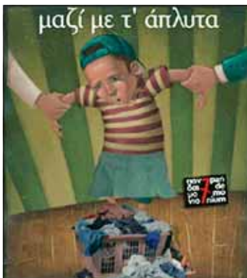
Μαζί με τ' άπλυτα