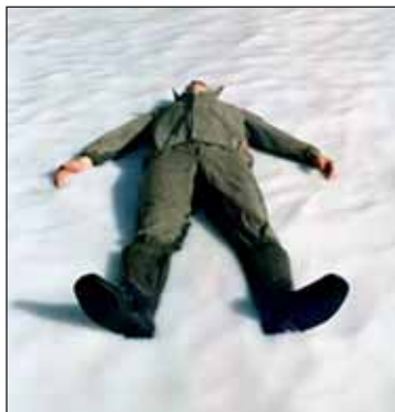
6ο FORUM Ευρωπαϊκών Πολιτιστικών Ανταλλαγών

ΘΕΑΤΡΙΚΗ ΠΑΡΑΣΤΑΣΗ «Δον Κιχώτης» του Θερβάντες, 9 Οκτωβρίου 2005