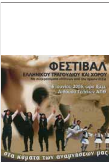
στα κύματα των αναμνήσεών μας