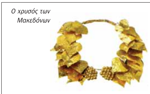
Ο χρυσός των Μακεδόνων