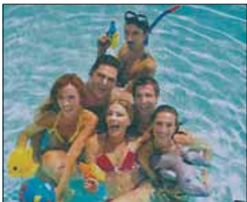
Μια μέλισσα τον Αύγουστο