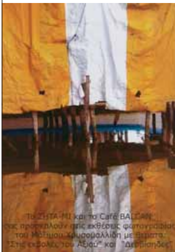
Το ΣΗΤΑ-ΜΙ και το Café ΒΑΣΙΛΗ που προεβλήσαν στις εκθέσεις φωτογραφίας του Μάξιμου Χρυσομαλλίδη με θέματα «Στις εκβολές του Αξιού» και «Ακροακτής»