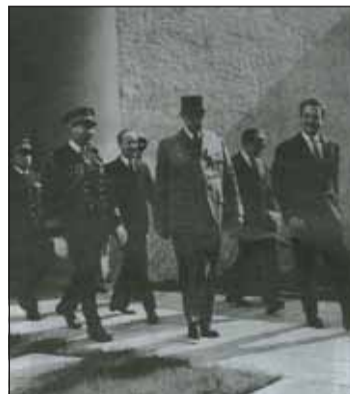
Salonique! ça va?