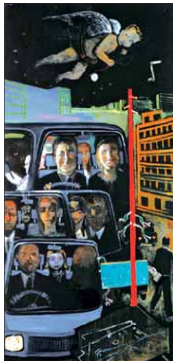
Ανατομία ενός ονείρου

ΕΚΘΕΣΗ ΦΩΤΟΓΡΑΦΙΑΣ της Ελένης Χοντολίδου, με τίτλο «Λονδίνο», μέχρι 3 Σεπτεμβρίου 2006, Ξενοδοχείο «Πόρτο Βαλίτσα» Παλιούρι Χαλκιδικής.