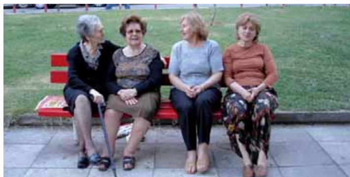
Ελληνίδες και Γεωργιανές στην Πλατεία Μακεδονομάχων