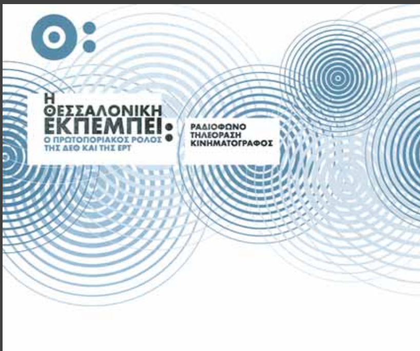
ΕΚΘΕΣΗ με μουσειακό, αρχαιολογικό, φωτογραφικό και οπτικοακουστικό υλικό, με τίτλο « Η Θεσσαλονίκη εκπέμπει: ο πρωτοποριακός ρόλος της ΔΕΘ και της ΕΡΤ (ραδιόφωνο, τηλεόραση, κινηματογράφος) », 8 Σεπτεμβρίου – 13 Ιανουαρίου 2008, Τελλόγλειο Ίδρυμα, Θεσσαλονίκη.