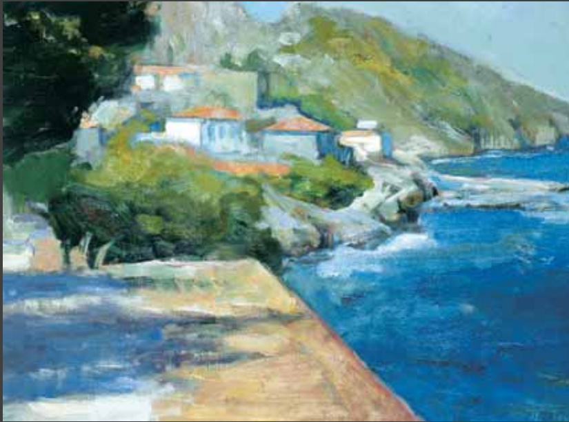
ΕΚΘΕΣΗ ΖΩΓΡΑΦΙΚΗΣ του Παναγιώτη Τούντα , 25 Σεπτεμβρίου – 13 Οκτωβρίου 2007, 1η Μπιενάλε Σύγχρονης Τέχνης, γκαλερί ATRION (Τσιμισκή 94), Θεσσαλονίκη.