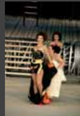
ΘΕΑΤΡΙΚΗ ΠΑΡΑΣΤΑΣΗ « Λυσιστράτη » του Αριστοφάνη, 27 Σεπτεμβρίου – 7 Οκτωβρίου 2007, ΚΘΒΕ, Βασιλικό Θέατρο, Θεσσαλονίκη.