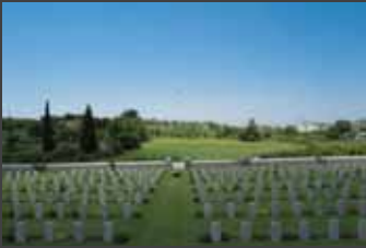
ΕΚΘΕΣΗ της Λίδας Παπακωνσταντίνου, με τίτλο « Εις το όνομα (In the name of) », 22 Σεπτεμβρίου – 10 Νοεμβρίου 2007, Παράλληλο Πρόγραμμα 1ης Μπιενάλε Σύγχρονης Τέχνης, Αποθήκη Β1 – Λιμάνι, Θεσσαλονίκη.