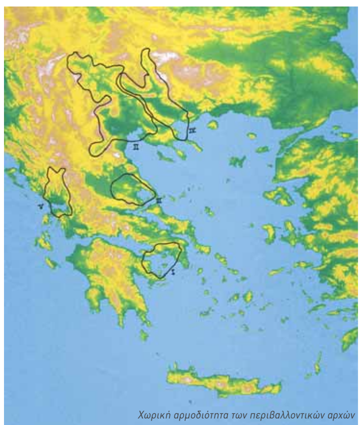
Χωρική αρμοδιότητα των περιβαλλοντικών αρχών

• Επιδίδεται να αλλάξουν τρόπο σκέψης, δράσης και διοίκησης οι επιχειρήσεις, ώστε εκμεταλλευόμενες τη σύγχρονη τεχνολογία να συνδυάζουν την ανάπτυξη με την παράλληλη προστασία του περιβάλλοντος (περιβαλλοντικός ή φυσικός καταλισμός).