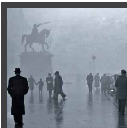
ΕΚΘΕΣΗ με τίτλο «Revolution I love you», 5 Μαΐου - 31 Αυγούστου 2008, στο πλαίσιο του αφιερώματος με τίτλο «Μέρες του '68», Κρατικό Μουσείο Σύγχρονης Τέχνης - Κέντρο Σύγχρονης Τέχνης - Φεστιβάλ Κινηματογράφου, Κέντρο Σύγχρονης Τέχνης (αποθήκη Β1, λιμάνι), Θεσσαλονίκη.