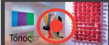
ΕΚΘΕΣΗ «Ο Τόπος», μια έκθεση, μια προσέγγιση, ένα μουσείο, μια ιστορία. Η σύγχρονη τέχνη στην Ελλάδα μέσα από τις συλλογές του Μακεδονικού Μουσείου Σύγχρονης Τέχνης, 5 Μαρτίου - 31 Αυγούστου 2008, ΜΜΣΤ (Εγνατίας 154), Θεσσαλονίκη.