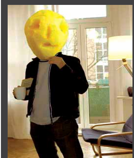
ΕΚΘΕΣΗ ΦΩΤΟΓΡΑΦΙΑΣ του Δημήτρη Τσουμπλέκα, με τίτλο «Οικογενειακές υποθέσεις», 18 Απριλίου - 24 Αυγούστου 2008, στο πλαίσιο της PHOTOBIBLIENALE, Μακεδονικό Μουσείο Σύγχρονης Τέχνης, Θεσσαλονίκη.