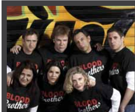
ΘΕΑΤΡΙΚΗ ΠΑΡΑΣΤΑΣΗ με τίτλο «Δεσμοί Αίματος (Bloodbrothers)», του Willy Russel, από το ΔΗ.Π.Ε. ΘΕ Βόλου και την «Θέσις», σε σκηνοθεσία Κώστα Σπυρόπουλου: • 5-6/8/2008: Θεσσαλονίκη • 7/8/2008: Βέροια • 13/8/2008: Θέατρο Σίβηρης • 16/8/2008: Αρχαίο θέατρο Διον • 19/8/2008: Δ. Συκεών