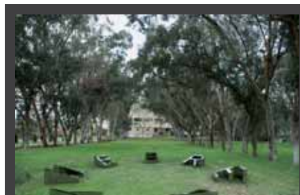
ΕΙΚΑΣΤΙΚΗ ΕΓΚΑΤΑΣΤΑΣΗ της Δανάης Στράτου, με τίτλο «Breathing Circle», 1 - 31 Αυγούστου 2008, Κέντρο Σύγχρονης Τέχνης και Sani Festival, Λόφος Σάνης.

«Του κουτρούλη ο Γάμος» σε ελεύθερη απόδοση και σκηνοθεσία Γιάννη Καλατζόπουλου, 6 Αυγούστου 2008, ΚΘΒΕ, Θέατρο Σίβηρης, Χαλκιδική.