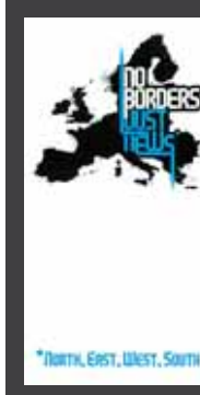
ΕΚΘΕΣΗ με τίτλο «No borders (just N.E.W.S.)», έργα 29 αποφοίτων 22 Σχολών Καλών Τεχνών από 22 ευρωπαϊκές χώρες, 19 Ιουνίου - 28 Σεπτεμβρίου 2008, Κέντρο Σύγχρονης Τέχνης - Διεθνής Ένωση Κριτικών Τέχνης (ΑΙΣΑ) - Κέντρο Σύγχρονης Τέχνης Βρυξελλών «La Centrale Electrique», λιμάνι (κτήριο παλιών Ψυγείων), Θεσσαλονίκη.