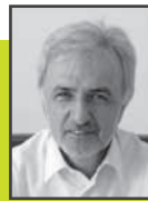
ΤΑΣΟΣ ΚΟΝΑΚΛΙΔΗΣ ΚΤΗΡΙΟ ΣΗΜΕΙΟ ΑΝΑΦΟΡΑΣ ΓΙΑ ΤΟΥΣ ΘΕΣΣΑΛΟΝΙΚΕΙΣ, ΚΤΗΡΙΟ ΟΡΟΣΗΜΟ

Επιτέλους το ΤΕΕ έχει το δικό του κτήριο στην Θεσσαλονίκη. Το όνειρο δεκαετιών έγινε πραγματικότητα. Αργήσαμε αλλά τα καταφέραμε. Το νέο λοιπόν κτήριο θα πρέπει να γίνει αναφορά για την πόλη τόσο για την απεριττή αρχιτεκτονική γραμμή του, όσο και για τις δράσεις που θα αναπτυχθούν μέσα σ' αυτό. Τα ντουβάρια, συναδέλφοι, παίρνουν μια άλλη αίσθηση όταν μέσα σ' αυτά συντελούνται δράσεις δημιουργίας. Και μεις όλοι καλούμαστε, με πρωτοπορία τους νεώτερους συναδέλφους, να αναπτύξουμε δράσεις μεγάλες και οραματικές, για την ανάπτυξη, για το περιβάλλον, για την πόλη. Πίστεια και πιστεύω με πάθος ότι ο άνθρωπος είναι το μέτρο του χώρου και του χρόνου. Κι είναι αυτός που βάζει τη μικρή ή μεγάλη πέτρα στη δόμηση του χθες και του σήμερα, που γίνεται αύριο στο διηνεκές.