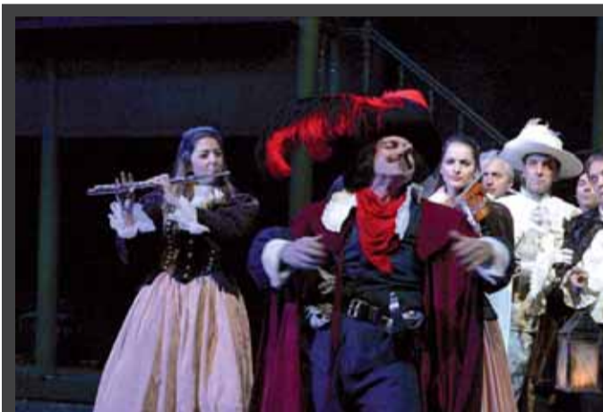
ΘΕΑΤΡΙΚΗ ΠΑΡΑΣΤΑΣΗ με τίτλο «Συρανόντε Μπερζεράκ», του Εδμόνδου Ροσάν, 21 Δεκεμβρίου 2007 – 5 Απριλίου 2008, ΚΘΒΕ, Βασιλικό θέατρο, Θεσσαλονίκη.