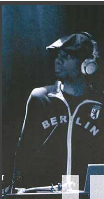
ΕΚΘΕΣΗ «Γερμανική JAZZ», 9 Ιανουαρίου – 17 Φεβρουαρίου 2008, γκαλερί του Goethe Institut (Βασ. Όλγας 66), Θεσσαλονίκη.