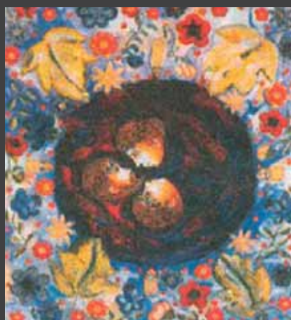
ΑΝΑΔΡΟΜΙΚΗ ΕΚΘΕΣΗ αιογραφίας και Βυζαντινής ζωγραφικής του Ιωάννη Μητράκα, με τίτλο «Ο Βυζαντινός κόσμος του Μητράκα», 9 Ιανουαρίου – 9 Φεβρουαρίου 2008, Casa Bianca, Θεσσαλονίκη.