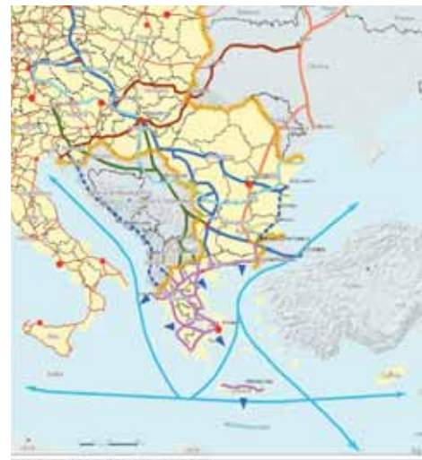
Χάρτης 3.2: Η Ελλάδα στο Βαλκανικό χώρο.

ρος ζητημάτων (ανταγωνιστικότητα, εδαφική και κοινωνική συνοχή, περιβάλλον). Προκύπτει, ωστόσο, ότι δεν εξυπηρετούνται επαρκώς στο σύνολο τους από τις κατευθύνσεις και τις προτάσεις, που αναλύονται στα υπόλοιπα άρθρα του ΓΠΧΣΑΑ (κυρίως λόγω ασάφειας/ελλιπούς εξειδίκευσης των τελευταίων). Επίσης, θα ήταν σκόπιμη η ιεραρχική παρουσίαση των στόχων, βάσει αποδιδόμενης βαρύτητας.