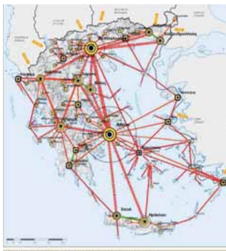
Χάρτης 12: Πολυκεντρική και ισόρροπη χωρική ανάπτυξη

φράση που να αφορά στη δυνατότητα επισήμανσης περιοχών εξυγιάνσης και στην ανάληψη προγραμμάτων σε αυτές, κατά το πρότυπο της Αθήνας - Αττικής.