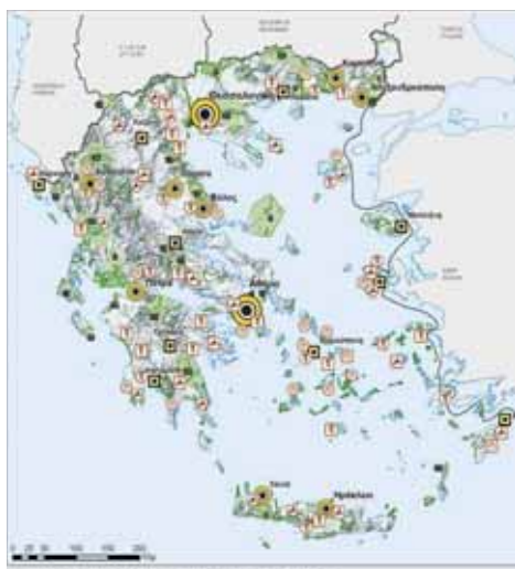
Χάρτης 10: Περιφέρειες φυσικού και πολιτιστικού πλούτου