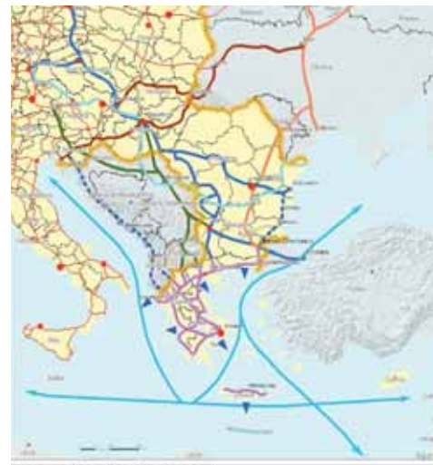
Χάρτης 3.2: Η Ελλάδα στο Βαλκανικό χώρο.

ρος ζητημάτων (ανταγωνιστικότητα, εδαφική και κοινωνική συνοχή, περιβάλλον). Προκύπτει, ωστόσο, ότι δεν εξυπηρετούνται επαρκώς στο σύνολο τους από τις κατευθύνσεις και τις προτάσεις, που αναλύονται στα υπόλοιπα άρθρα του ΓΠΧΣΑΑ (κυρίως λόγω ασάφειας/ελλιπούς εξειδίκευσης των τελευταίων). Επίσης, θα ήταν σκόπιμη η ιεραρχική παρουσίαση των στόχων, βάσει αποδιδόμενης βαρύτητας.