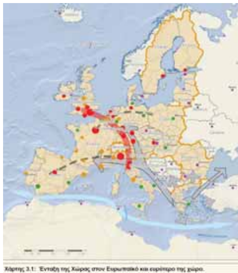
Χάρτης 3.1: Ένταξη της χώρας στον Ευρωπαϊκό και ευρύτερο της χώρας.

Άρθρο 2 (Στόχοι): Αναγκαία η ιεράρχηση των στόχων. Σε πρώτο επίπεδο, οι στόχοι καλύπτουν σημαντικό εύ-