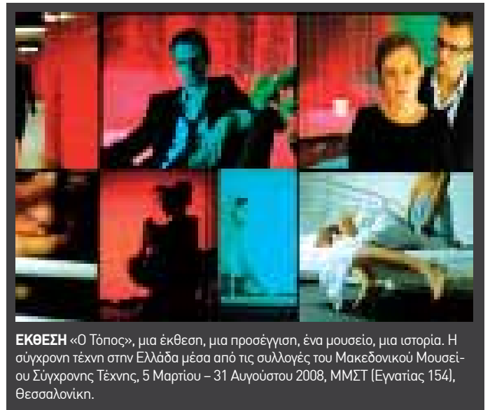
ΕΚΘΕΣΗ «Ο Τόπος», μια έκθεση, μια προσέγγιση, ένα μουσείο, μια ιστορία. Η σύγχρονη τέχνη στην Ελλάδα μέσα από τις συλλογές του Μακεδονικού Μουσείου Σύγχρονης Τέχνης, 5 Μαρτίου – 31 Αυγούστου 2008, ΜΜΣΤ (Εγνατίας 154), Θεσσαλονίκη.