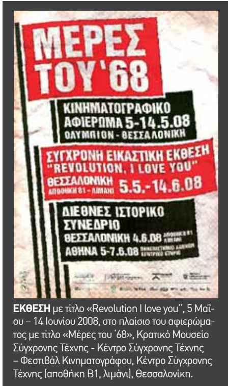
ΕΚΘΕΣΗ με τίτλο «Revolution I love you», 5 Μαΐου – 14 Ιουνίου 2008, στο πλαίσιο του αφιερώματος με τίτλο «Μέρες του '68», Κρατικό Μουσείο Σύγχρονης Τέχνης - Κέντρο Σύγχρονης Τέχνης - Φεστιβάλ Κινηματογράφου, Κέντρο Σύγχρονης Τέχνης (αποθήκη Β1, λιμάνι), Θεσσαλονίκη.