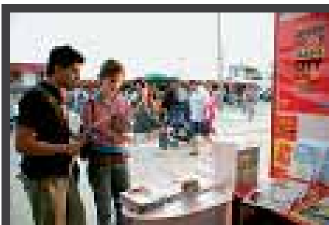
26ο ΦΕΣΤΙΒΑΛ ΒΙΒΛΙΟΥ , 1 - 17 Ιουνίου 2007, Σύνδεσμος Εκδοτών Β.Ε. σε συνεργασία με τον Δήμο Θεσσαλονίκης - Αντιδημαρχία Πολιτισμού, υπό την αιγίδα των ΥΠΠΟ και ΥΜΑΘ, παραλία Λευκού Πύργου, Θεσσαλονίκη.