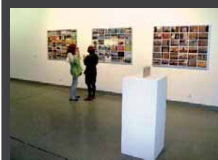
ΕΚΘΕΣΗ με τίτλο «Revolution I love you», 5 Μαΐου - 14 Ιουνίου 2008, στο πλαίσιο του αφιερώματος με τίτλο «Μέρες του '68», Κρατικό Μουσείο Σύγχρονης Τέχνης - Κέντρο Σύγχρονης Τέχνης - Φεστιβάλ Κινηματογράφου, Κέντρο Σύγχρονης Τέχνης (αποθήκη Β1, λιμάνι), Θεσσαλονίκη.