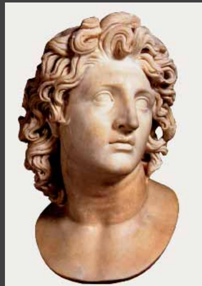
ΠΕΡΙΟΔΙΚΗ ΕΚΘΕΣΗ με τίτλο «Μέγας Αλέξανδρος: Έργα από τις Συλλογές της Μακεδονίας και εικονογραφία του μύθου στην Ιταλία», 28 Μαΐου - 15 Νοεμβρίου 2008, Αρχαιολογικό Μουσείο - Ιταλική Πρεσβεία - Ιταλικό Μορφωτικό Ινστιτούτο, Θεσσαλονίκη.