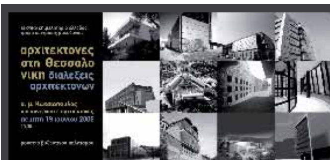
ΔΙΑΛΕΞΗ του αρχιτέκτονα - καθηγητή του ΑΠΘ Τάσου Κωτσιόπουλου, στο πλαίσιο της ενότητας «Αρχιτέκτονες στη Θεσσαλονίκη», Πέμπτη 19 Ιουνίου 2008, ΤΕΕ/ΤΚΜ, Μουσείο Βυζαντινού Πολιτισμού, Θεσσαλονίκη.

3ο ΕΘΝΙΚΟ ΣΥΝΕΔΡΙΟ «Ήπιες επεμβάσεις για την προστασία ιστορικών κατασκευών. Νέες τάσεις σχεδιασμού», 19 έως 21 Μαρτίου 2009, Υπουργείο Πολιτισμού/Εφορεία Νεωτέρων Μνημείων Κ. Μακεδονίας και το ΤΕΕ/ΤΚΜ, σε συνεργασία με τη Διεύθυνση Περιβάλλοντος & Υποδομών του ΥΜΑΘ και το Διατμηματικό Μεταπτυχιακό Πρόγραμμα της Πολυτεχνικής Σχολής του Ε.Μ.Π. «Προστασία Μνημείων», Θεσσαλονίκη.