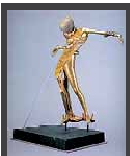
ΕΚΘΕΣΗ γλυπτών και χαρακτικών «Salvador Dalí - Ο μύθος του σουρεαλισμού», 7 Απριλίου - 16 Ιουνίου 2008, Δημοτική Πινακοθήκη (Βασ. Όλγας & 25ης Μαρτίου), Θεσσαλονίκη.