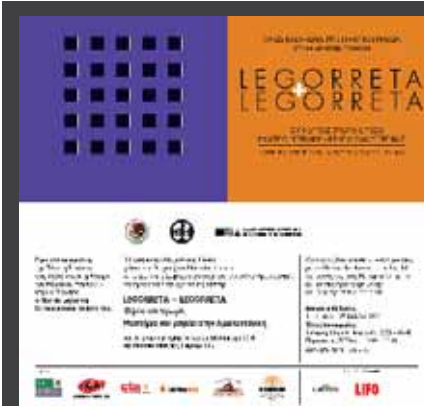
ΕΚΘΕΣΗ «LEGORRETA + LEGORRETA: Όψεις και χρώμα. Μυστήρια και μαγεία στην Αρχιτεκτονική», 11 Ιουνίου - 27 Ιουλίου 2008, Πρεσβεία Μεξικού - Μουσείο Μπενάκη - Ελληνικό Κέντρο Αρχιτεκτονικής, αμφιθέατρο Μουσείου Μπενάκη (κτίριο οδού Πειραιώς), Θεσσαλονίκη.