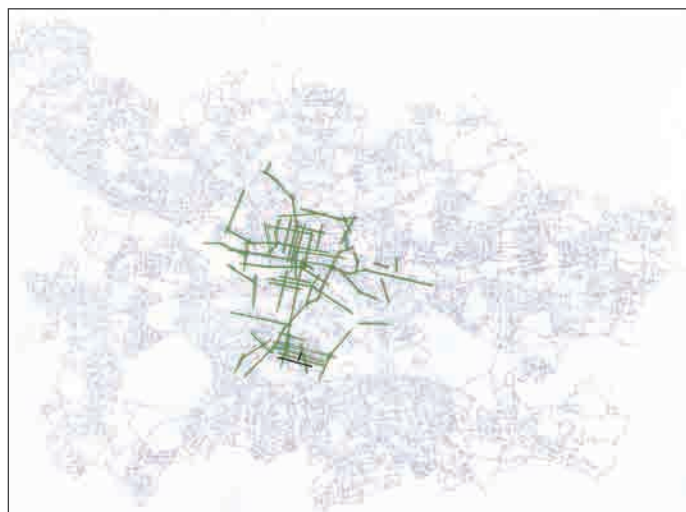
Χωρική (συντακτική) Ταυτότητα της Θεσσαλονίκης Π.Π.Ε. 1997 (Iden)

Η συσχέτιση των δύο χαρτών έδωσε χρήσιμα συμπεράσματα για τον τρόπο, που οι άνθρωποι της Γλασκώβης Π.Π.Ε. 1990 ανέληφθησαν τον ρόλο του δημοσίου χώρου της πόλης τους σ' αυτό το μείζον γεγονός.