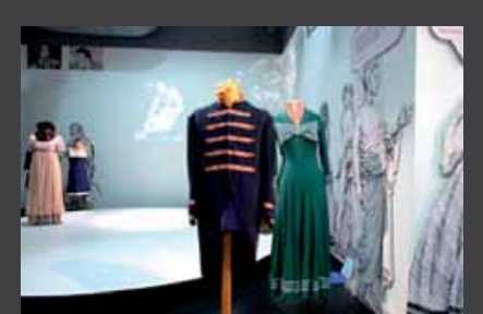
ΜΗΝΑΣ ΘΕΑΤΡΟΥ , μια διακρατική θεατρική συνάντηση με Κύπρο, Τουρκία, Σερβία και Ελλάδα, με τίτλο «Μήνας θεάτρου – Κρατικές σκηνές ΝΑ Ευρώπης», 17 Σεπτεμβρίου – 19 Οκτωβρίου 2008, ΚΘΒΕ, Θεσσαλονίκη.

• 16/10-19/10: «Ρεμπέτικο» του Κώστα Φέρρη, από το Κρατικό Θέατρο Άγκυρας, Βασιλικό Θέατρο