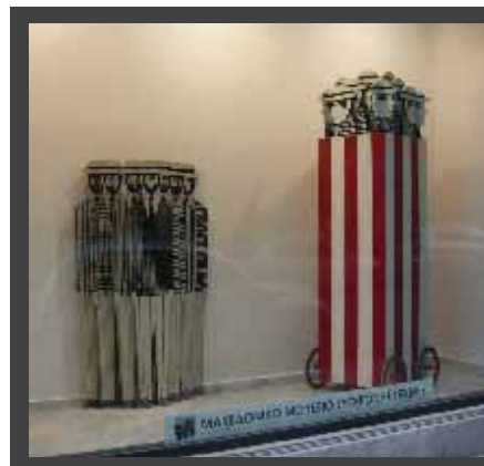
ΑΝΑΔΡΟΜΙΚΗ ΕΚΘΕΣΗ ΖΩΓΡΑΦΙΚΗΣ του Γιάννη Γαϊτή, με τίτλο «Γιάννης Γαϊτής 1923-1984: Όλοι και Μόνος», 6 Σεπτεμβρίου – 14 Δεκεμβρίου 2008, Μακεδονικό Μουσείο Σύγχρονης Τέχνης και Ίδρυμα Ι. Φ. Κωστόπουλου, ΜΜΣΤ (Εγνατίας 154), Θεσσαλονίκη.