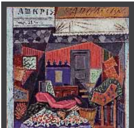
ΕΚΘΕΣΗ ΖΩΓΡΑΦΙΚΗΣ του Νίκου Χατζηκυριάκου – Γκίκα, 14 Οκτωβρίου – 10 Δεκεμβρίου 2008, 43α ΔΗΜΗΤΡΙΑ, Δημοτική Πινακοθήκη, Θεσσαλονίκη.