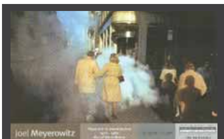
ΕΚΘΕΣΗ ΦΩΤΟΓΡΑΦΙΑΣ του Joel Meyerowitz, με τίτλο «Joel Meyerowitz 1970-1980 Πέρα από το συνηθισμένο», 3 Οκτωβρίου – 2 Νοεμβρίου 2008, Μουσείο Φωτογραφίας (αποθήκη Α', λιμάνι, Θεσσαλονίκη).