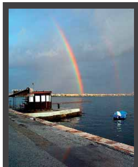
ΕΚΘΕΣΗ ΦΩΤΟΓΡΑΦΙΑΣ του Alain Ceccaroli, με τίτλο «Φωτογραφίζοντας τη Θεσσαλονίκη», 1 – 24 Οκτωβρίου 2008, 43α ΔΗΜΗΤΡΙΑ, Γαλλικό Ινστιτούτο, σε συνεργασία με την Πρεσβεία της Γαλλίας και το Μουσείο Φωτογραφίας, Γαλλικό Ινστιτούτο, Θεσσαλονίκη.