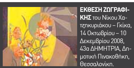
ΕΚΘΕΣΗ ΖΩΓΡΑΦΙΚΗΣ του Νίκου Χατζηκυριάκου – Γκίκα, 14 Οκτωβρίου – 10 Δεκεμβρίου 2008, 43α ΔΗΜΗΤΡΙΑ, Δημοτική Πινακοθήκη, Θεσσαλονίκη.