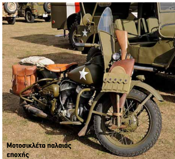
Μοτοσικλέτα παλαιάς εποχής